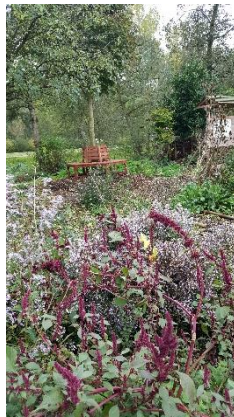
Asters en amarant